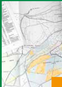
Le Plan Simple de Gestion

S’engager dans une gestion raisonnée de sa forêt, programmer les coupes et travaux