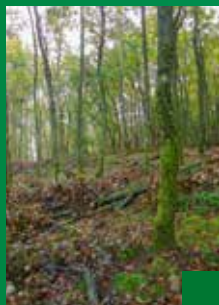
Le Règlement Type de Gestion