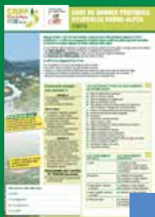
Le Code de Bonnes Pratiques Sylvicoles