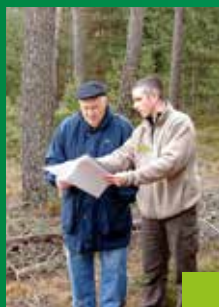
Les garanties de gestion durable, le SRGS, qui peut vous aider ?