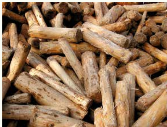
→ Billons écorcés pour la papeterie

Le bois exploité en première éclaircie n'a que peu de valeur marchande : trituration (papeterie, ...), bois énergie, billons de petit sciage et parfois des poteaux.