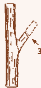
Chicot : futur défaut dans le bois

L'élagage à grande hauteur doit permettre d'obtenir une bille d'au moins 6 m de hauteur sans branche, qui produira deux billons de sciage de haute qualité.