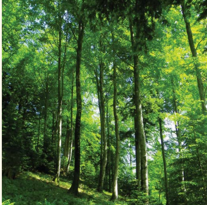
→ Jeune futaie à St Hilaire du Touvet (38)

Traditionnellement le hêtre était traité en futaie régulière dense sur une période assez longue. Cette gestion a entraîné des problèmes de pérennité des peuplements et de qualité des bois. L'objectif actuel est de produire du hêtre en futaie claire, plus ou moins mélangée, avec une révolution « courte » de 80 à 100 ans. La faible densité concentre la production sur un nombre d'arbres limité, pour accroître la stabilité du peuplement et limiter le phénomène de cœur rouge. Le hêtre conduit trop serré produit du bois de tension, nerveux, impropre au sciage : la qualité du hêtre augmente si la densité des tiges diminue et si sa croissance est rapide.