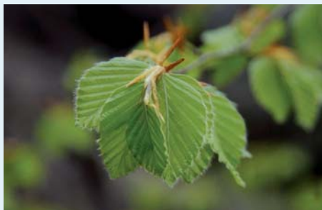
→ Jeunes feuilles

■ Le hêtre est rare en plaine dans notre région, et absent des vallées internes des massifs alpins.