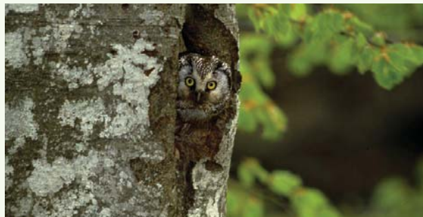
→ Chouette de Tengmalm