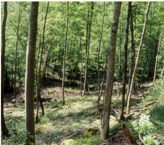
→ Taillis balivé à Hauteville-Lompnès (01)

Avec ces arbres d'avenir, un peuplement de bourrage sera également conservé pour obtenir 400 à 600 tiges par hectare, et servira notamment à l'« éducation » des baliveaux (élagage naturel...). Par la suite des coupes d'amélioration interviendront tous les 6-8 ans, réduisant à chaque passage la densité du peuplement.