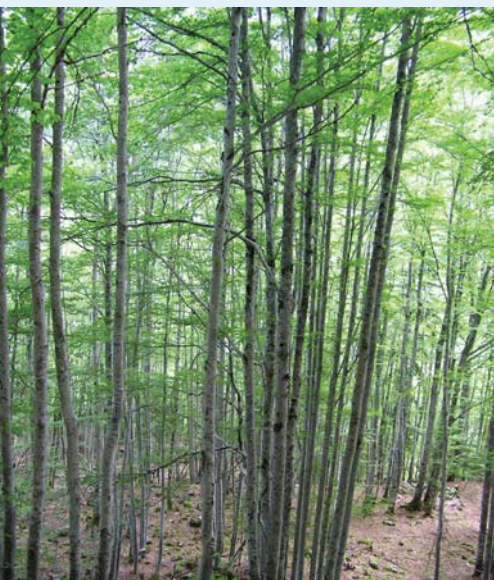
→ Taillis à St Ruph (74)

■ Couramment appelé « fayard », le hêtre a souvent été favorisé en montagne pour la production de charbon de bois et de bois de feu, au détriment du résineux.