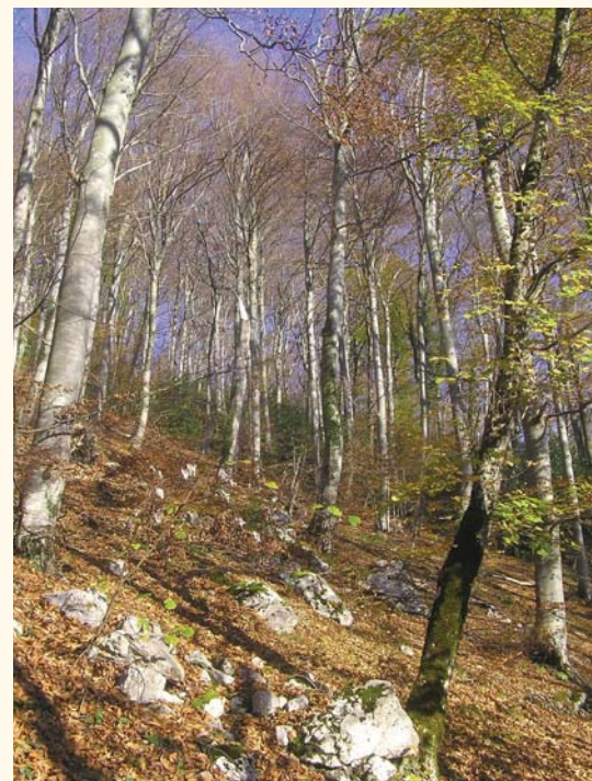
→ Hêtraie à St Jean d'Arvey (73)

Ces peuplements constituent un patrimoine individuel et collectif qu'il convient de gérer.