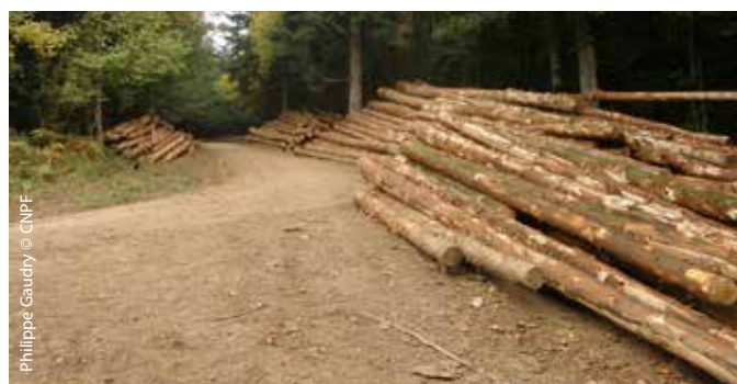
Philippe Gauthy © CNPF

L'État accompagne le CRPF pour faire émerger des projets de desserte au sein des territoires.