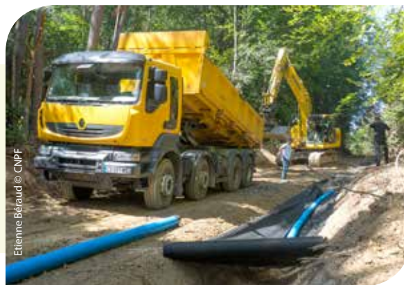
Etienne Béraud © CNPF

Pour notre commune de 3 478 ha (forestière à 50 %, avec 300 ha de forêt communale) située au cœur du Pilat, la création de voiries forestières était un véritable enjeu. Certains massifs étaient pratiquement inexploitable ou à des coûts prohibitifs : grâce à l'appui précieux du CRPF, en 14 ans nous avons pu réaliser en 4 tranches (+ 1 projet programmé pour 2019) 12 km de route forestière. D'ici la fin du mandat nous aurons réalisé ces projets, ce qui n'était pas gagné d'avance, avec des aides publiques de 80 % complétées par la contribution des propriétaires à hauteur de 20 %.